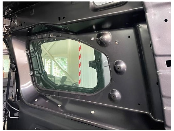
Салон та вантажне відділення